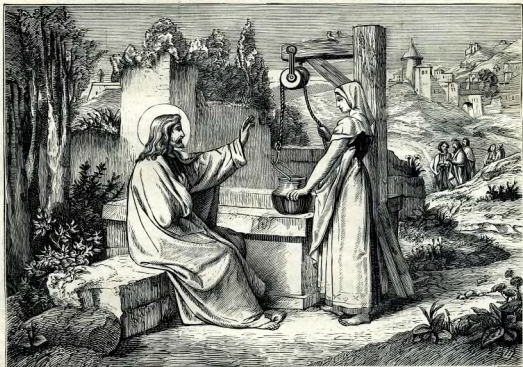
XI. Беседа съ Самарянкою.